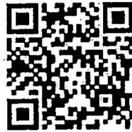
สแกน QR CODE เพื่อตอบแบบสำรวจ

สถาบันโรคทรวงอก ขอความร่วมมือ บุคลากรภายในสถาบันฯ ร่วมตอบแบบสำรวจ"การรับรู้ เข้าใจ และสามารถนำแผนปฏิบัติการกรม การแพทย์ ระยะ: 5 ประจำปีงบประมาณ พ.ศ. 2566 ไปปฏิบัติ" ผ่านระบบ ออนไลน์ โดยสามารถสแกน QR CODE ภายในวันที่ 15 สิงหาคม 2566