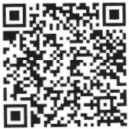
กำหนดการ