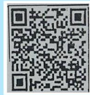
แบบสอบถาม

สถาบันโรคทรวงอก ขอความร่วมมือข้าราชการ ที่เป็นสมาชิกกองทุน บำเหน็จบำนาญข้าราชการ (กบข) ดำเนินการตอบแบบสอบถาม เรื่อง ปัจจัยที่มีผล ต่อการออม การลงทุน และการบริหารเงินของสมาชิก กบข. โดยสามารถทำแบบ สอบถามได้ที่ แอปพลิเคชัน กบข. หรือ Line กบข. ที่เมนู "สิทธิพิเศษ และ GPF Point" หรือ Scan QR Code ในระหว่างวันที่ 11 สิงหาคม 2565 - 30 พฤศจิกายน 2565