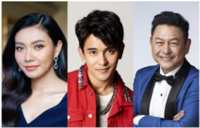
แถ่ม วิชฎาณี ถัน นกัทร ถน ทรงสิทธิ